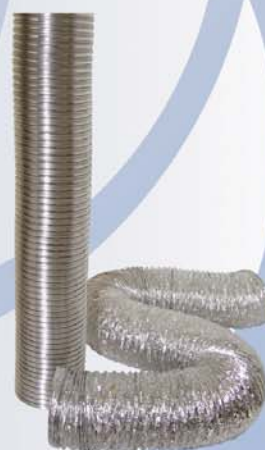
Ductos de Aluminio