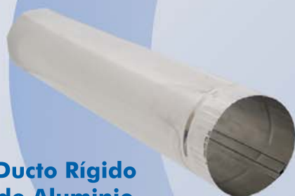
Ducto Rígido de Aluminio