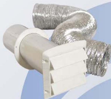
Kit de Extracción