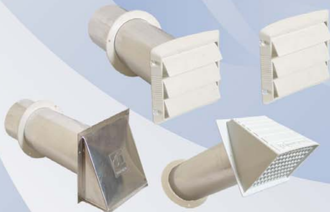
Campanas y Repuestos