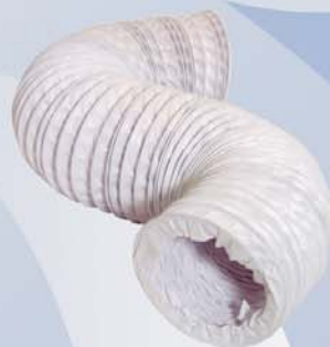
Conductos de Vinilo